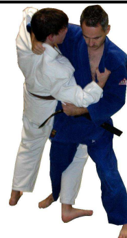
O-soto-otoshi (großer Außensturz)