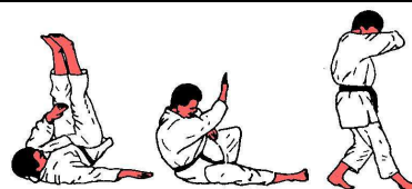
Fallen zur Seite, aus dem Stand (Yoko-ukemi)