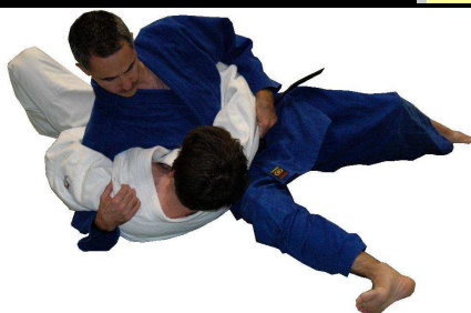
Kuzure-kesa-gatame (Variante des Schärpen-Haltegriffs)