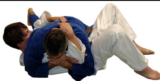
Mune-gatame (Brust-Haltegriff, Variante des Yoko-Shiho-Gatame)

Im Gegensatz zur Prüfungsordnung von 2004 müssen die Griffe nicht mehr beidseitig demonstriert werden! Deshalb nur noch 2 anstatt 4 Aktionen!