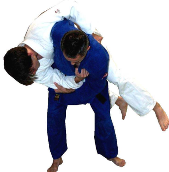
O-goshi (großer Hüftwurf)